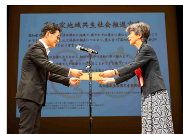
地域共生社会フォーラムで 濱田知事から宣言書を交付 (R5.10.7) (高知県民生委員児童委員協議会連合会)