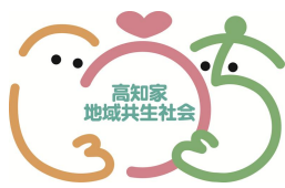
高知家地域共生社会シンボルマーク

シンボルマークの詳細や利用規程はこちら→ からご確認ください。 (高知家地域共生社会ポータルサイト)